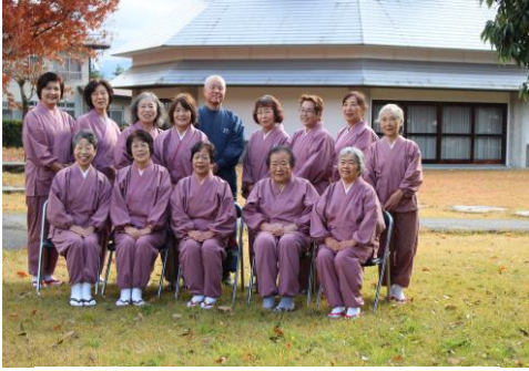
民話会ゆうづるの皆さん