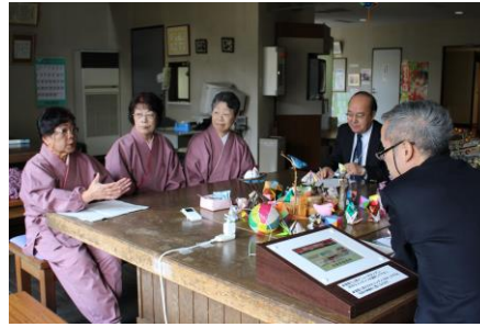
インタビューの様子

置賜地域に配付されて います月刊「あづま〜る」の 一月号（十二月二十日発 行）に民話会ゆうづるの記 事が掲載されます。 表紙はもちろんですが、 活動の様子がたっぷり紹 介されています。 是非ご覧になつて下さい。