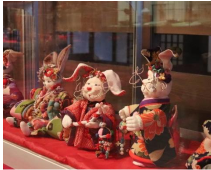
毎年大人気のウサギ

展示では、今年の干支ウサギのちりめん細工を多数展示しております。展示をよく見ると意外なところで見つけることができますので、是非探してみてください。