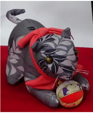
『続おさいくもの』 (明治45年)より製作

また、二月二十二日は猫と一緒に暮らせる幸せに感謝する猫の日だそうです。そのことにちなんで特別に猫のちりめん細工を制作していただきました。こちら是非ご覧ください。