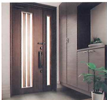
リフォーム玄関ドア リシェント

夏は涼しく、冬は暖かく。お住まいの地域に合わせて断熱性能を選べます。防犯性もアップしてデザインも一新。壁を壊さない簡単リフォームです。