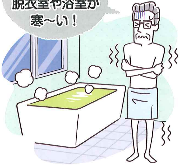
血圧の変化のイメージ