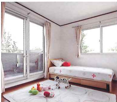
断熱内窓 (二重窓) インプラス

今ある窓の内側に新しい窓を取付けるだけ。1窓最短1時間のスピード施工で断熱性がアップして、結露も軽減します。