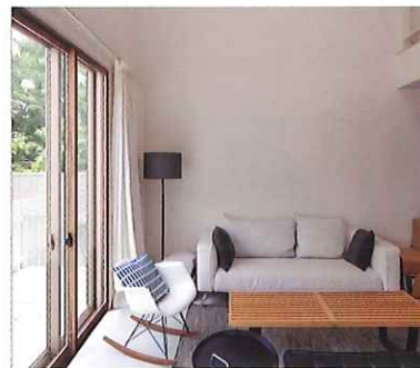
インプラス for リノベーション

インプラスの断熱性能はそのままに、優れたデザイン性で空間に調和するリノベーションシリーズ。現代のインテリアに馴染む「デザイン」でも選べる窓です。