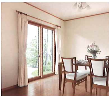
断熱内窓 (二重窓) インプラス

今ある窓の内側に新しい窓を取付けるだけ。1窓最短1時間のスピード施工で断熱性がアップして、エアコン効率アップ。冬場の結露も軽減します。