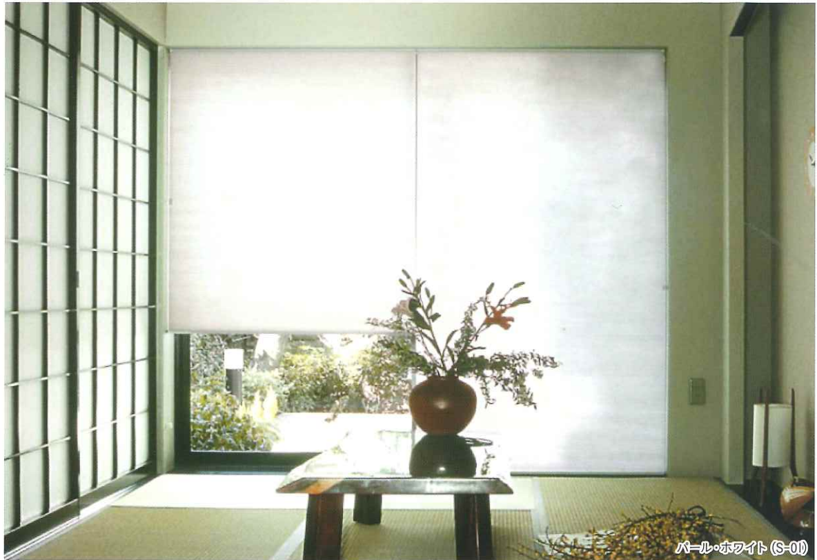
パール・ホワイト (S-01)

和紙のような風合いは、和室にもマッチします。 出入りをする引き違い窓では、二つに分けて設置しても便利です。