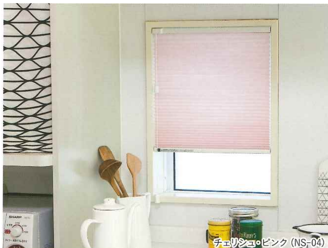
チェリシヨ・ピンク (NS-04)

和紙のような風合いは、和室にもマッチします。 出入りをする引き違い窓では、二つに分けて設置しても便利です。