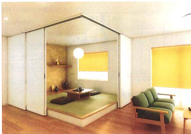
コーナー突合せ部分

コーナーをL字に仕切って新たに空間を創ることができます。 和室や寝室にしたりと、部屋の用途が広がります。