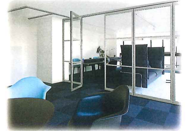
オフィスにミーティングルームを創る