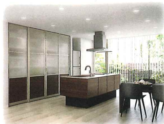
キッチンの壁面収納に