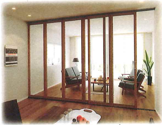
リビング・ダイニングの仕切りに