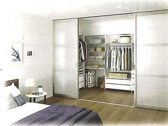
ウォークインクローゼットの扉に