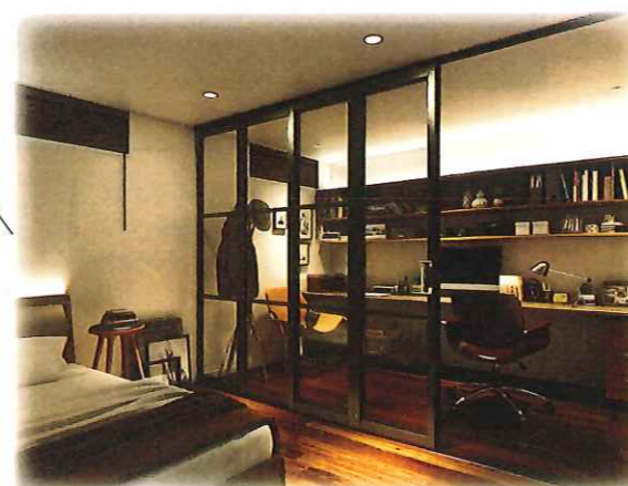
寝室に書斎を創る