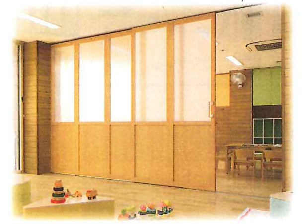
教育施設のクラスの仕切りに