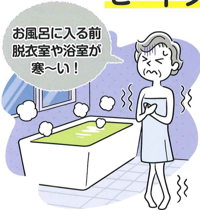
血圧の変化のイメージ