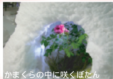
かまくらの中に咲くぼたん

お問合せ 山形県高島町観光協会 〒999-2173 山形県東置賜郡高島町大字山崎200番地-1 0238-57-3844 http://www.takahata.info