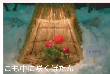
こも中に咲くぼたん

ワールドフードフェア(予定) 世界各国の料理大集合! チビッコ大イベント(予定) 雪上宝探し ほか