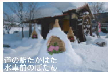
道の駅たかはた 水車前のぼたん