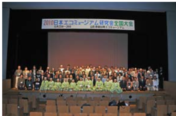
全国大会参加者と浮島雅楽保存会の皆さんで記念撮影

日本におけるエコミュージアムの発展を目的に、同研究会の全国大会（10/23~24）を開催し、全国から 100 人近い実践者や研究者が集まりました。浮島雅楽保存会の神秘的な演奏で迎え、案内人や住民講師のみなさんによる見学会、参加者全員でのディスカッションなど、大変成果のあった大会と評価をいただきました。