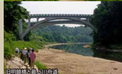
旧明鏡橋と最上川舟道